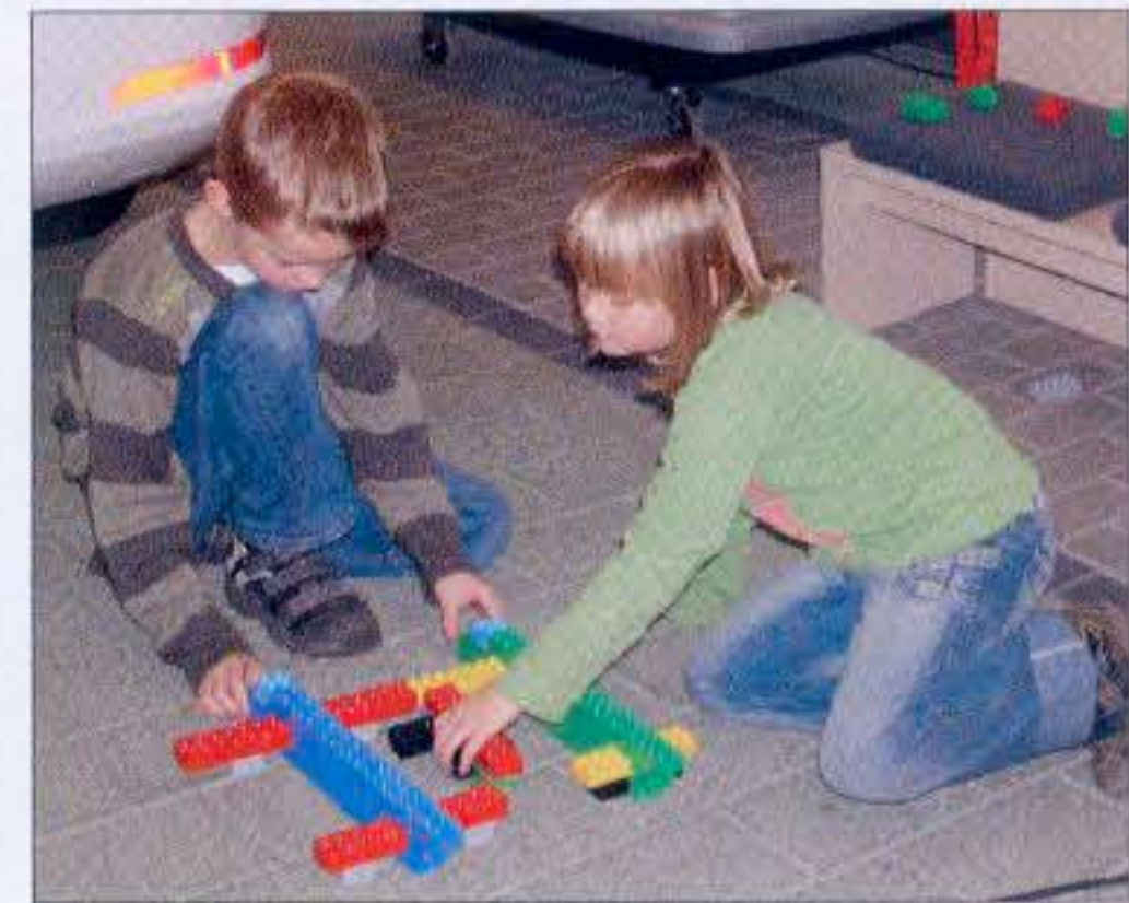
Kinder brauchen nicht viel Platz, um spielen zu können. Hauptsache das Spielzeug ist das richtige.

bei Mothor fast gar nicht. In seiner Firmenphilosophie nimmt die familiäre Atmosphäre einen wichtigen Platz ein. Und das ist nicht nur so dahingesagt. Seine Mitarbeiter haben 15 Kinder – Tendenz steigend.